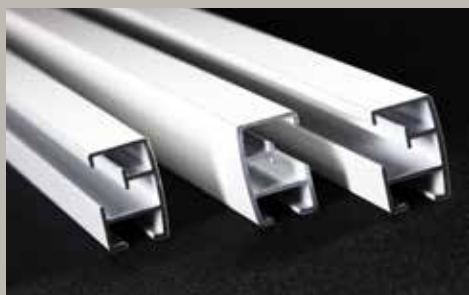
Skena Vision – En kraftigare skena med något rundad front. För medeltunga till tunga uppsättningar.