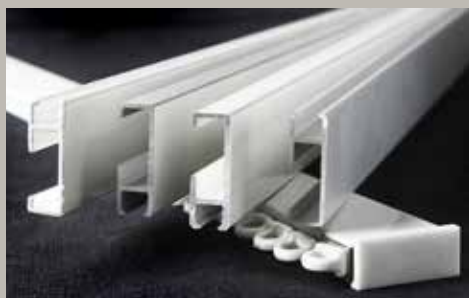
Skena Elit – Luxaflex® allroundskena. För lätta till medeltunga uppsättningar