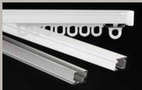
Skena U – En liten, smidig skena till lättare uppsättningar. Finns även hålslagen för montering direkt i tak.