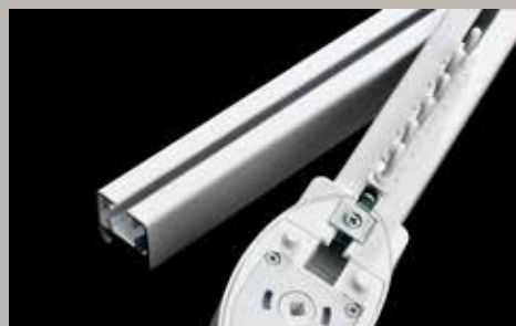
Skena Glydea – En motoriserad skena för tyngre uppsättningar. Manövreras med fjärrkontroll och s k touch motion.